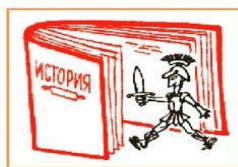
Вошёл в историю