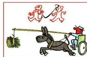
Водить за нос