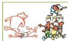
Медведь на ухо наступил